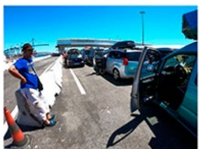
Un hombre sale de su vehículo en la zona del Puerto de Algeciras en la Operación Paso del Estrecho de 2018.

La Operación Paso del Estrecho comienza con polémica: Interior buscó agentes de refuerzo, pero sin pagar dietas, por lo que los 7 de cada 10 plazas de apoyo se han quedado sin cubrir. Se esperan 3 millones de personas en 3 meses